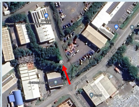
15 rue Eiffel – DUCOS