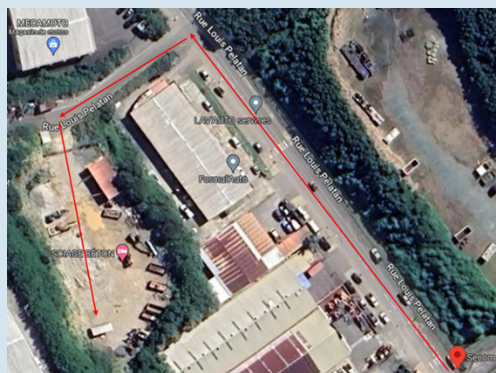
Rue Louis PELATAN – DUCOS